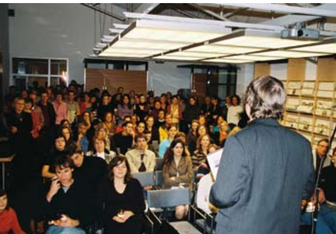
Lesung in der UB Passau