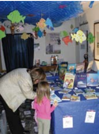
Wanderausstellung in Wachendorf

Auf dem Weg zum überfüllten Zeitungscafé, in dem heute Barmusik angeboten wird, sehe ich durch die Fenster im Hof Feuerschein: Dort gibt es gerade eine Vorführung „Mit Schwert und Feuerzauber“. Die Kolleginnen der Stadtbibliothek sind hoch zufrieden mit der Besucherfrequenz, die am Ende auf 1.400 Personen geschätzt wird. Alle Altersgruppen sind hier, viele sind mit ihren Familien gekommen. Trotz des Trubels finden einzelne Leser sogar noch die Muße, sich zwischen den Regalen in ein Buch zu vertiefen. Später wird sich ein