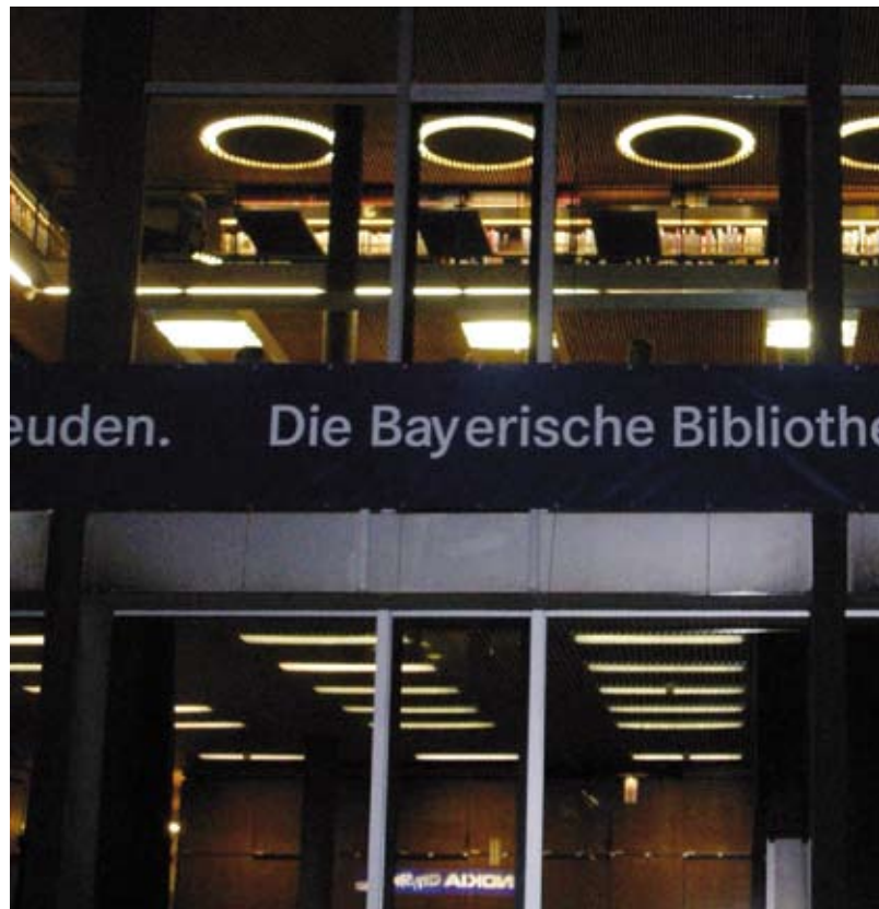
Außenwerbung am Germanischen Nationalmuseum