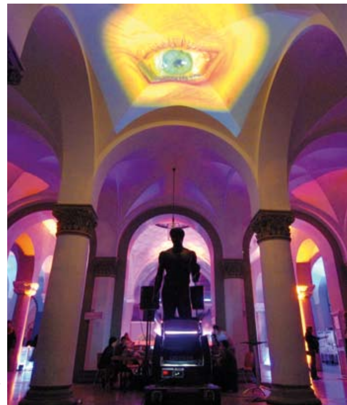
Multimedia-Installation in der UB München

Den stärksten Zulauf hatte eine Podiumsdiskussion mit Professoren aus den theologischen Fakultäten, die sich dem Phänomen „Da Vinci Code“ aus wissenschaftlicher Sicht annäherte. Auch für die Professoren war es eine neue Erfahrung, dass mit den Themen einer Lehrveranstaltung ein breites Publikum erreicht werden kann. Die sechs Geschossebenen der Fachbibliothek wurden durch unterschiedliche Multimedia- und Toninstallationen, Ausstellungen und Leseecken erschlossen. Für das „Jahr der Geisteswissenschaften 2007“ hat der Veranstalter der Wissenschaftstage bereits großes Interesse an einer Zusammenarbeit mit der Universitätsbibliothek signalisiert. Eine Gleichzeitigkeit von Kulturnächten sollte in Zukunft aber auf jeden Fall vermieden werden, meinen die Münchener Bibliothekare.