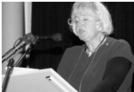
Bundesministerin Renate Schmidt

Aus der Rede von Renate Schmidt, Bundesministerin für Familie, Senioren, Frauen und Jugend, anlässlich der Eröffnung der Aktion „Lesespaß - wie geht denn das?“ am 1. März 2004 in Nürnberg