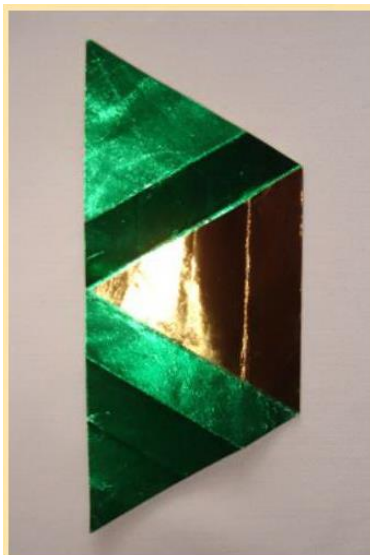
Stern falten 3

Faltet nun eine Ecke des Dreiecks bis zur gegenüberliegende Seite (die Hälfte der Dreiecksseite).