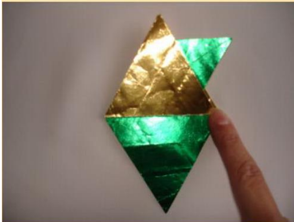
Stern falten 5

Fahrt mit den anderen beiden Dreiecksspitzen fort wie unter Schritt 1 und 2 beschrieben.