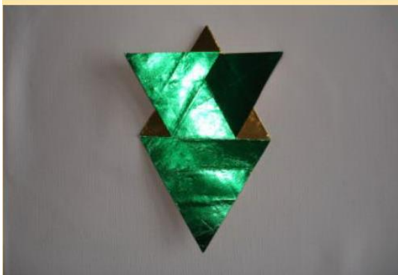
Stern falten 6

Fahrt mit den anderen beiden Dreiecksspitzen fort wie unter Schritt 1 und 2 beschrieben.