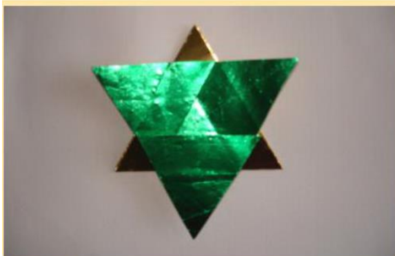
Stern falten 8