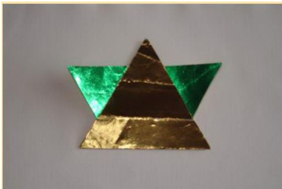
Stern falten 7