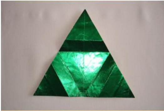
Stern falten 2

https://www.kinderspiele-welt.de/basteln-und-werkeln/falten/sterne-falten.html