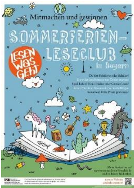
Plakat DinA 3