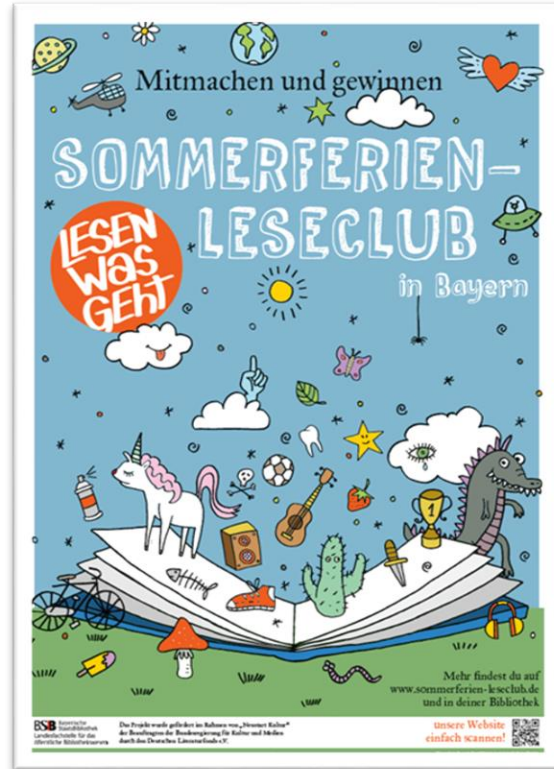
Plakate (A3 und A2)