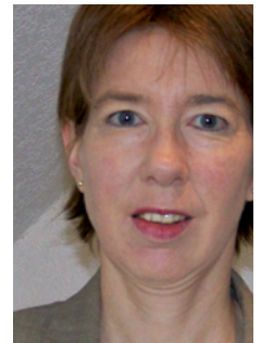
DIE AUTORIN Sabine Teigelkämper, M. A., Bayerische Staatsbibliothek, Landesfachstelle für das öffentliche Bibliothekswesen, Außenstelle Würzburg

Die folgenden Jahresberichte von Bibliotheken stellen die vorab erläuterten Prinzipien exemplarisch dar, darunter einige Beispiele von Teilnehmern der AG Bibliotheksmanagement Franken, die diese im Rahmen eines Arbeitstreffens präsentierten.